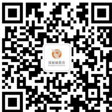
锐如镒教师 官方公众号